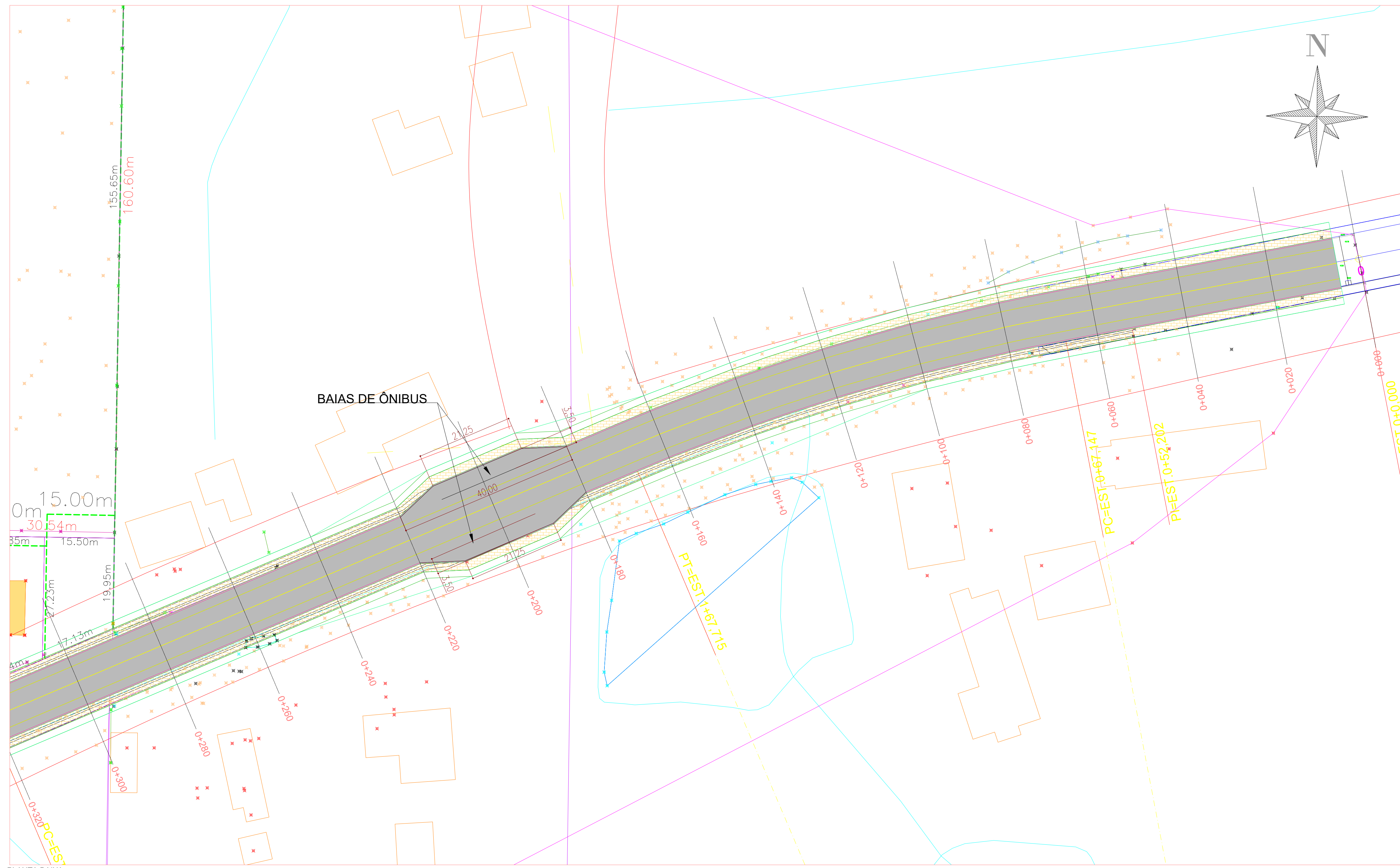
PLANTA BAIXA ESTACA 0+000 A 0+300 ESC: 1/500