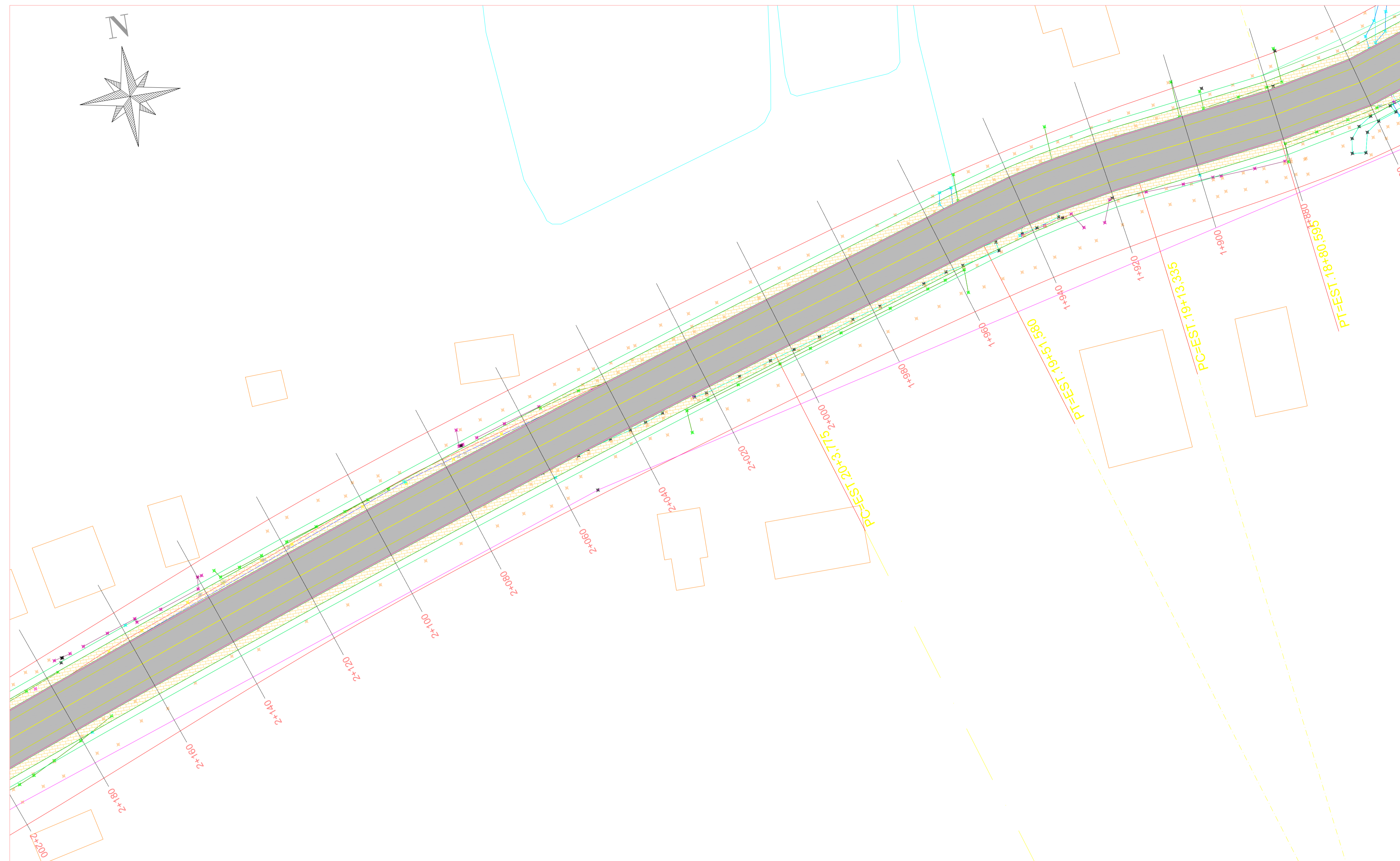
PLANTA BAIXA ESTACA 1+860 A 2+180 ESC: 1/500