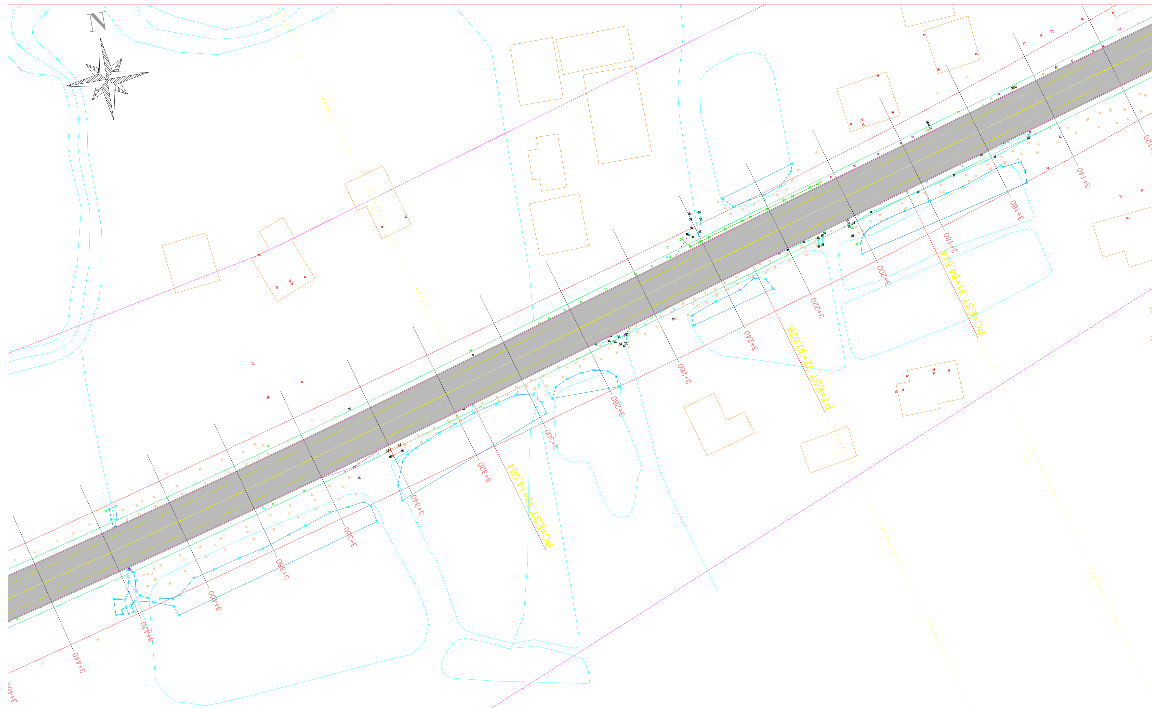
PLANTA BAIXA ESTACA 3+120 A 3+440 ESC: 1/500