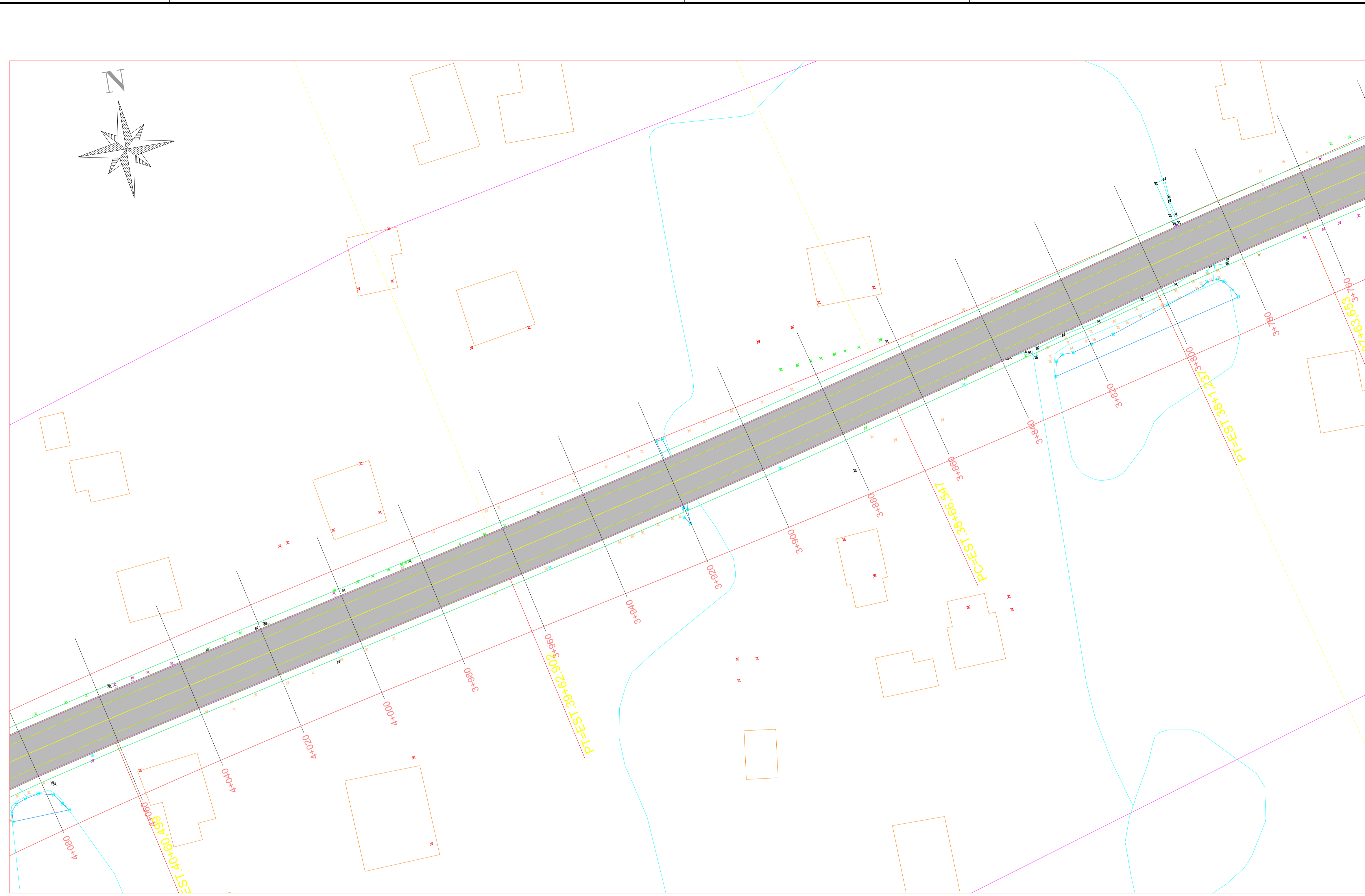
PLANTA BAIXA ESTACA 3+760 A 4+080 ESC: 1/500