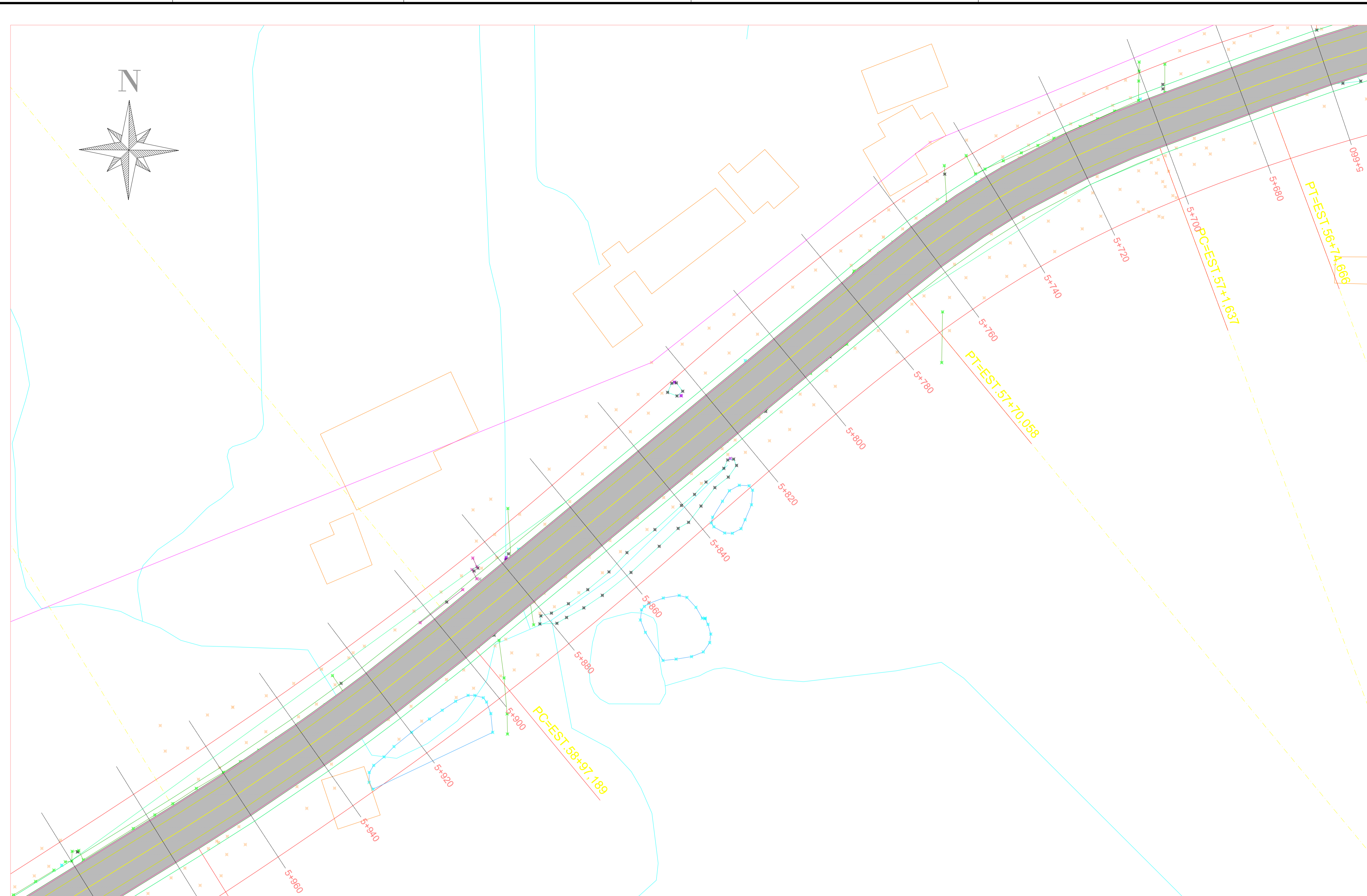
PLANTA BAIXA ESTACA 5+660 A 5+960 ESC: 1/500