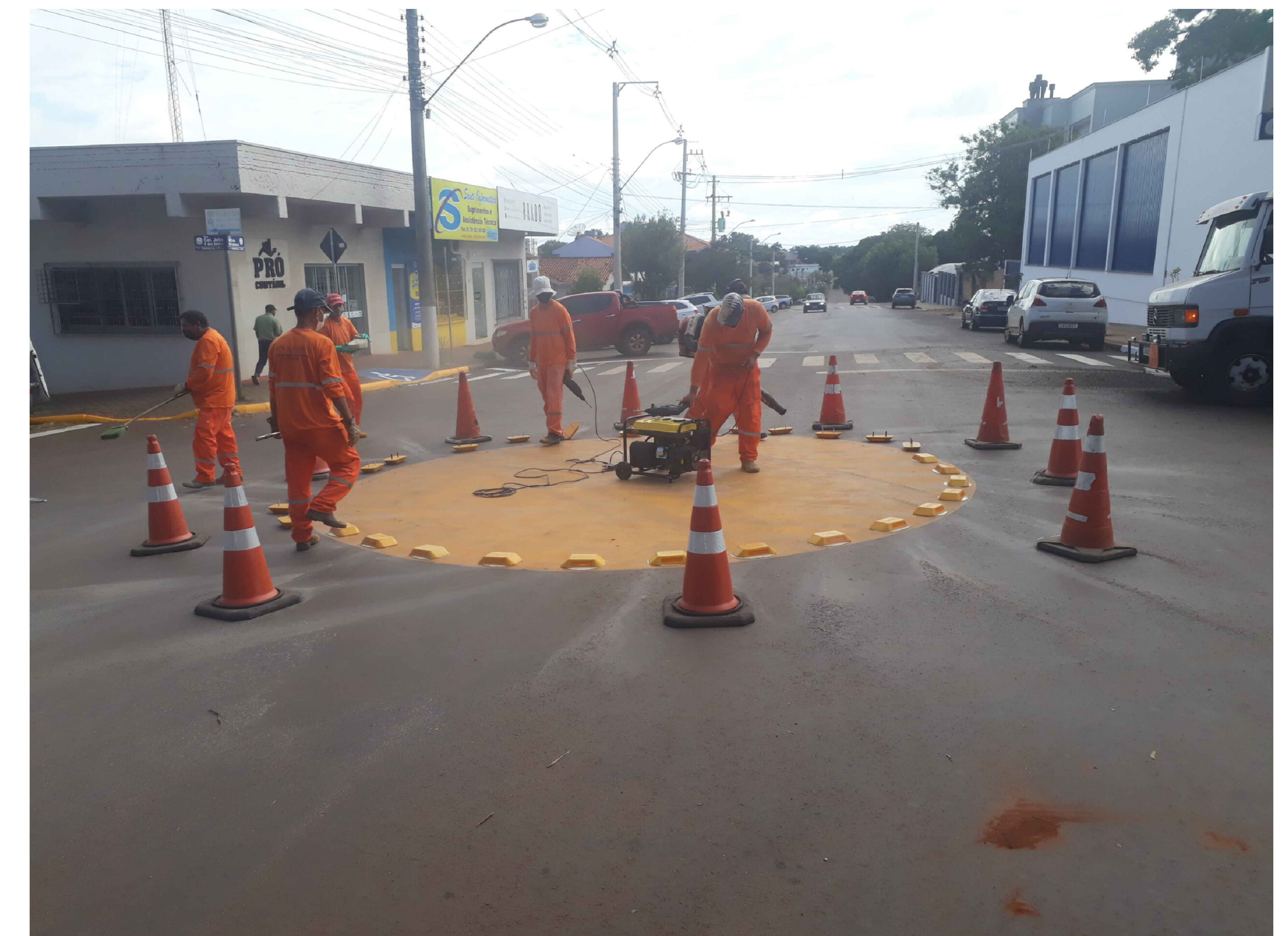
PINTURA DE TREVO